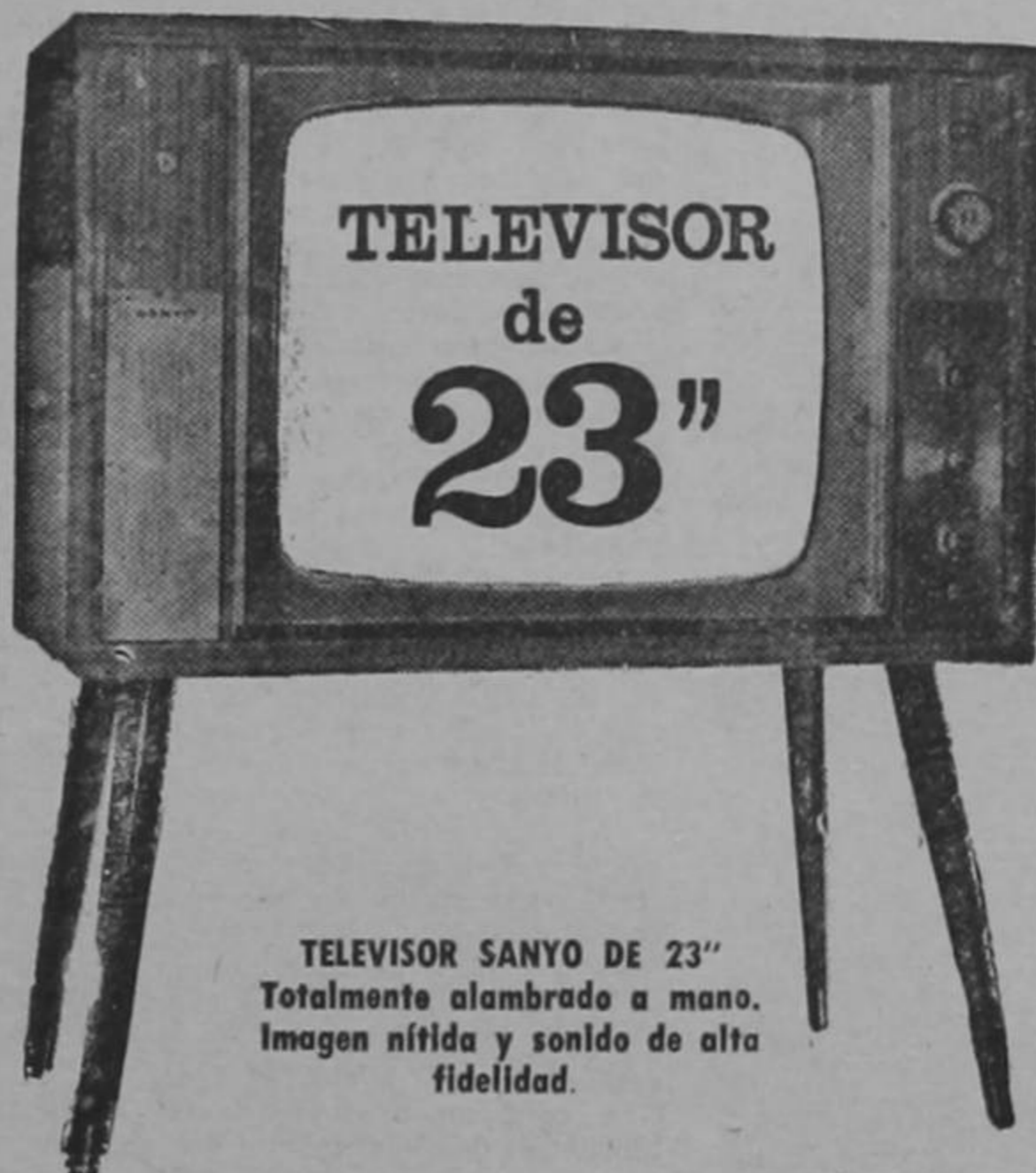
TELEVISOR SANYO DE 23" Totalmente alambrado a mano. Imagen nítida y sonido de alta fidelidad.

Aproveche la sensacional PROMOCION DE VENDEDORES solamente esta semana.