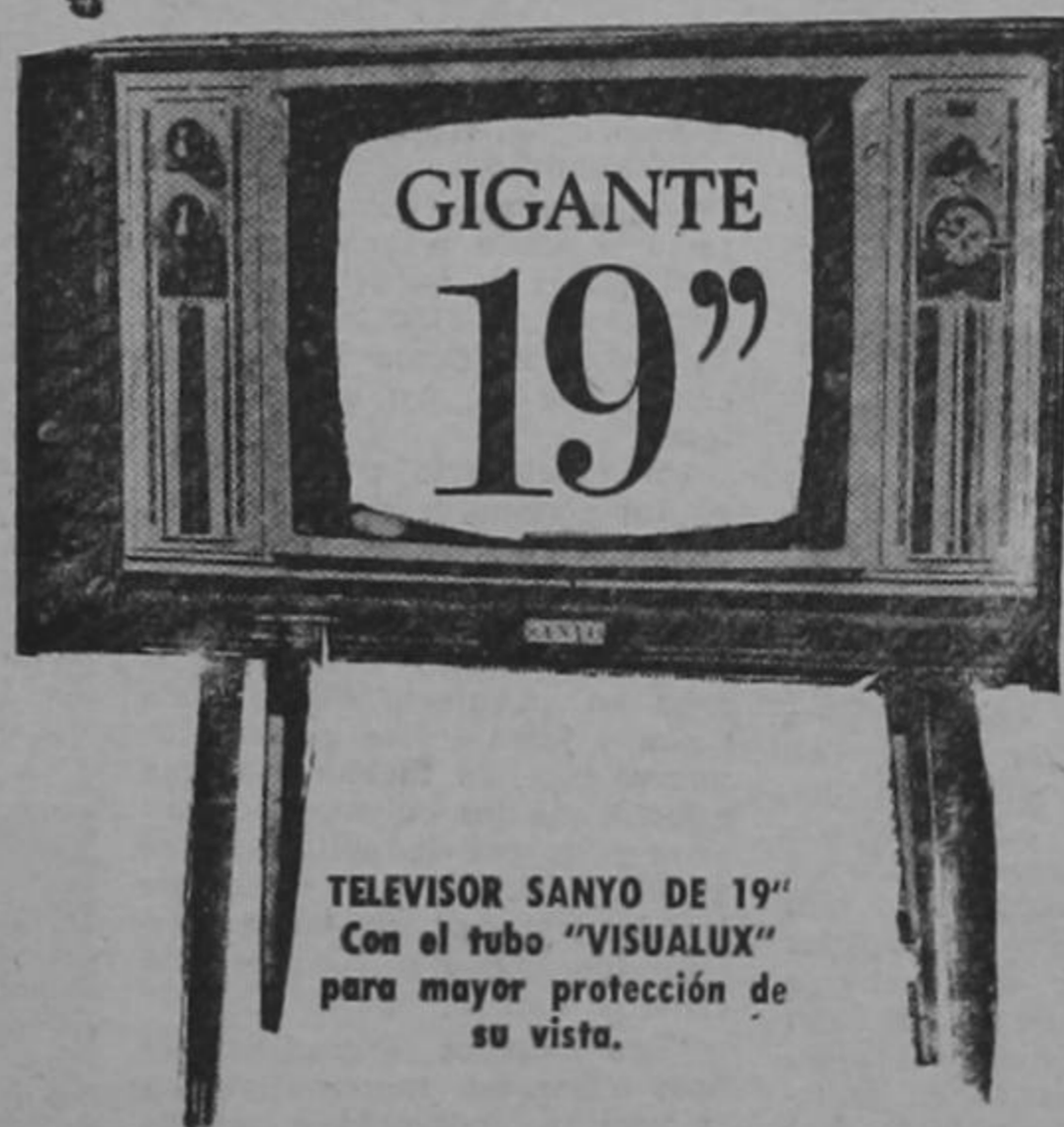
TELEVISOR SANYO DE 19" Con el tubo "VISUALUX" para mayor protección de su vista.