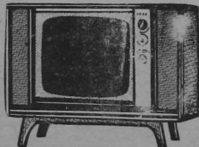
CONSOLA "ADMIRAL" Modelo "DECORADOR" pantalla de 23".