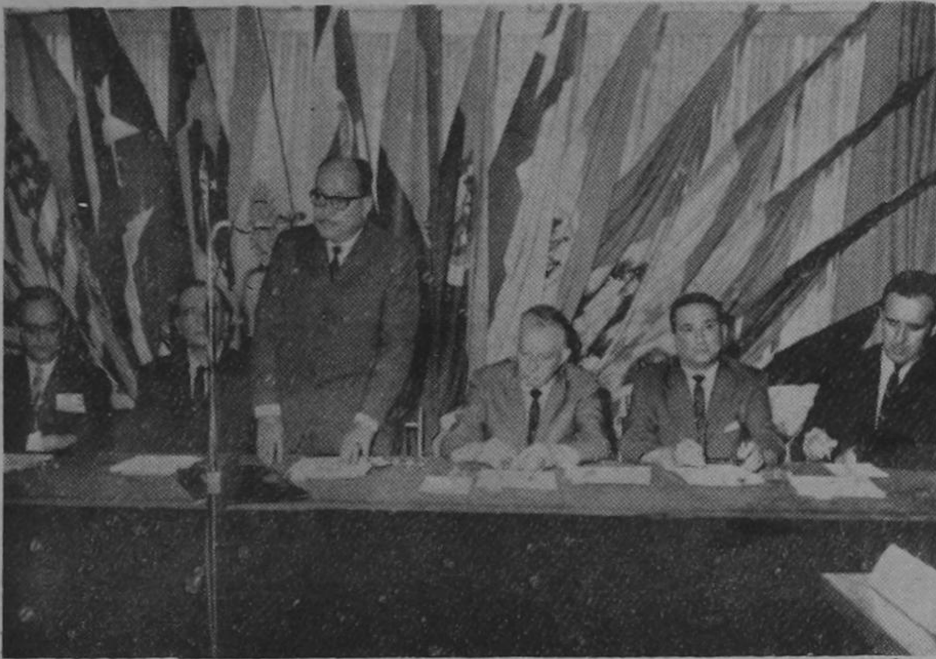
El Lic. Virgilio Calvo en nombre del Presidente de la República declaró inaugurado el Seminario Centroamericano sobre Información y la Alianza para el Progreso. En la ceremonia estuvo el Ministro de Relaciones Exteriores, el Presidente de la Asamblea Legislativa, representantes de la O. E. A., diplomáticos e invitados.

Año XVI — N° 5042 — San José, Costa Rica — Martes 16 de Mayo de 1967 — Edición de 40 Páginas — Precio ₡ 0.25