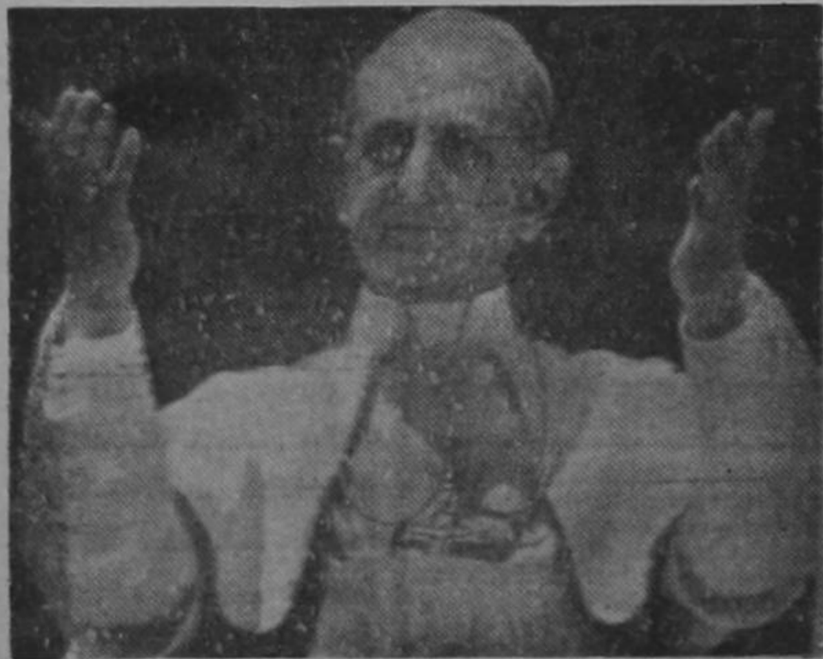
CIUDAD DEL VATICANO, 14 de mayo —AP— El Papa Paulo VI bendice a una multitud desde la ventana de su apartamento el domingo de Pentecostés, dijo que la inspiración del Espíritu Santo era "el principio de la vida cristiana", el Pontífice dijo al enorme gentío en la Plaza de San Pedro que trajo "la bendición de María" desde Fátima, que visitó ayer en un viaje en avión a Portugal al Santuario de Fátima. (AP Wirephoto) 1967

Paraguay conmemora su 156 aniversario de la Independencia política con diversos actos a los que se han asociado diferentes países.