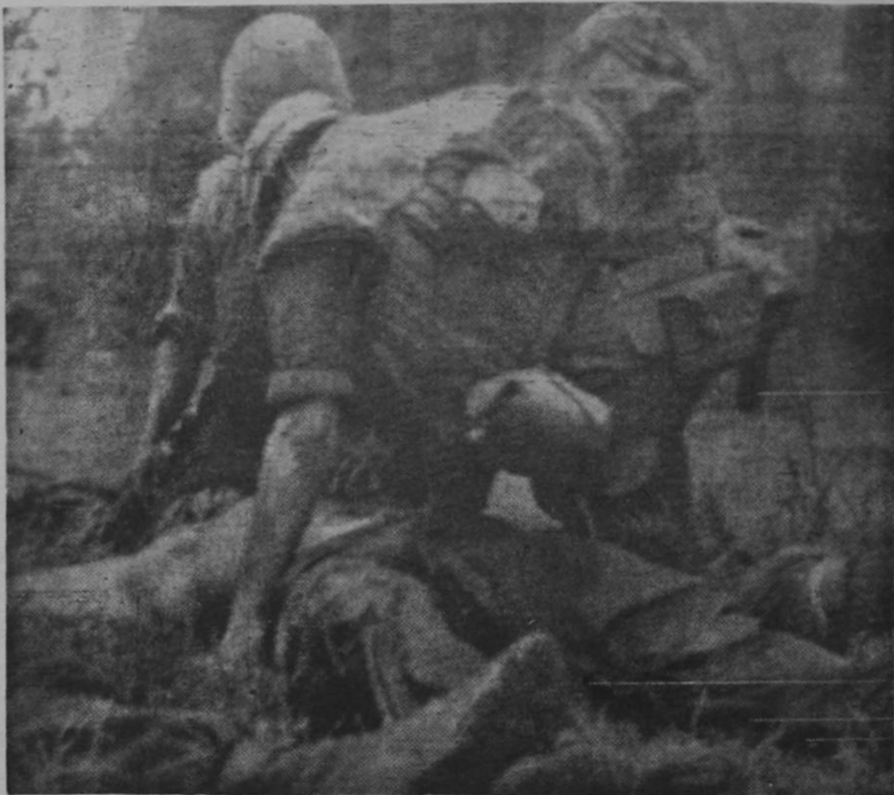
SAIGON.—En Poon Thien, Vietnam Meridional, un marino de infantería de Estados Unidos presta auxilios a un compañero herido cerca de la zona desmilitarizada. Hubo 9 muertos y 46 heridos norteamericanos, y 24 guerrilleros norvietnamitas.

Los chinos comunistas enviaron las demandas al gobierno inglés a través del encargado británico de negocios en Pekín. En una de las demandas se pide la libertad de todos los chinos arrestados durante los disturbios de la semana pasada en Kowloon, y el castigo a los funcionarios "responsables por esas sangrientas atrocidades".